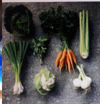
Øhave Posen – 21 uger