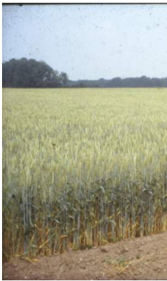
Vårsæd m. udlæg