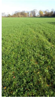
1.års kl. græs