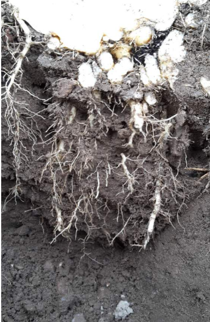
Radby. JB 4. økologisk i 3 år.