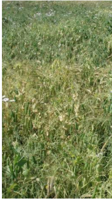
Byg/ært m. udlæg